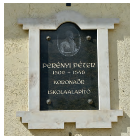
A Perényi Péter Általános Iskola (Kossuth u. 11.) felújítási és ener- getikai fejlesztési munkáihoz kapcsolódva az óvoda, majd a bővítésként elindított Kisdud Óvó Mini Bölcsőde tervezési munkái, 2011-2016

kerített sort a miként tudását, anyagi jártas- ságát művelő mesterek és műhelyek közös látogatására is.