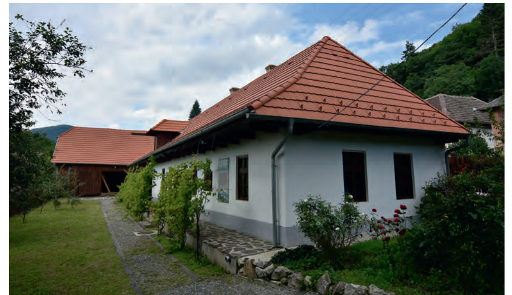
Váruradalmi Kézművesház, szín, csűr és pavilonok valamint Rendezvényi tér (Rákóczi u. 2.) épület- és téregyüttesének felújítási, átalakítási és bővítési munkái, 2009-2019