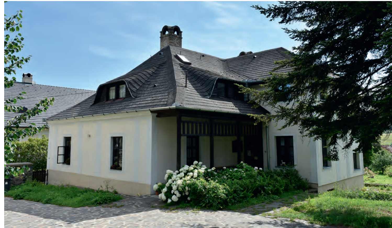
Plébániaépület és helytörténeti kör, egykori Dessewffy kúria (Rákóczi u. 1.) homlokzatfelújítási munkálatai, 2009