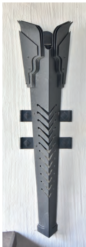
Jobbra: a fali lámpatest modellje, majd végleges kialakítása Balra: a kápolna állólámpái