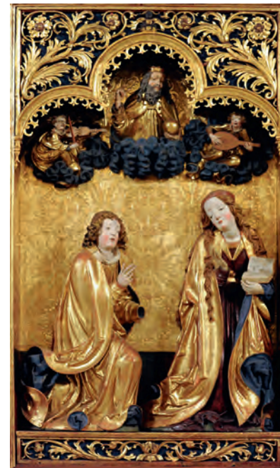
A kisszebeni Angyali üdvözlés-oltár, 1520