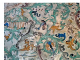
Falképek a felvidéki Árva várában