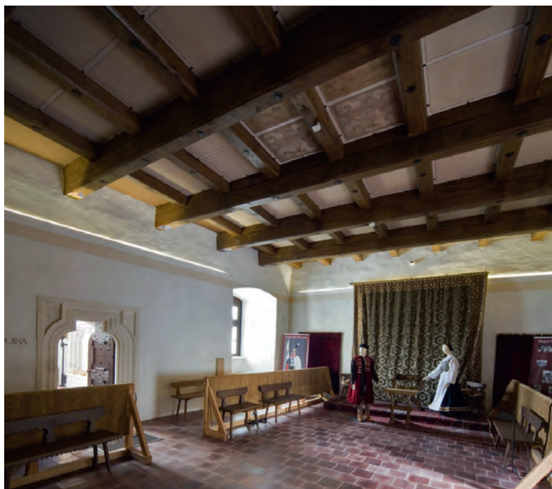
Fakazettás mennyezet az Öreg palotában

falfestéssel párhuzamosan. A festett dús ornamentika ezekben a szobabelsőkben a falikárpitokat és a faliszőnyegeket idézik, ezért síkszerűség és sokszor ismétlődő motívumok jellemzik azokat.