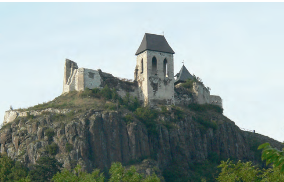
A felső vár állapota 2008-ban, a rekonstrukció előtt