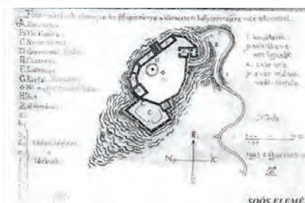
Soós Elemér rajzai, 1903