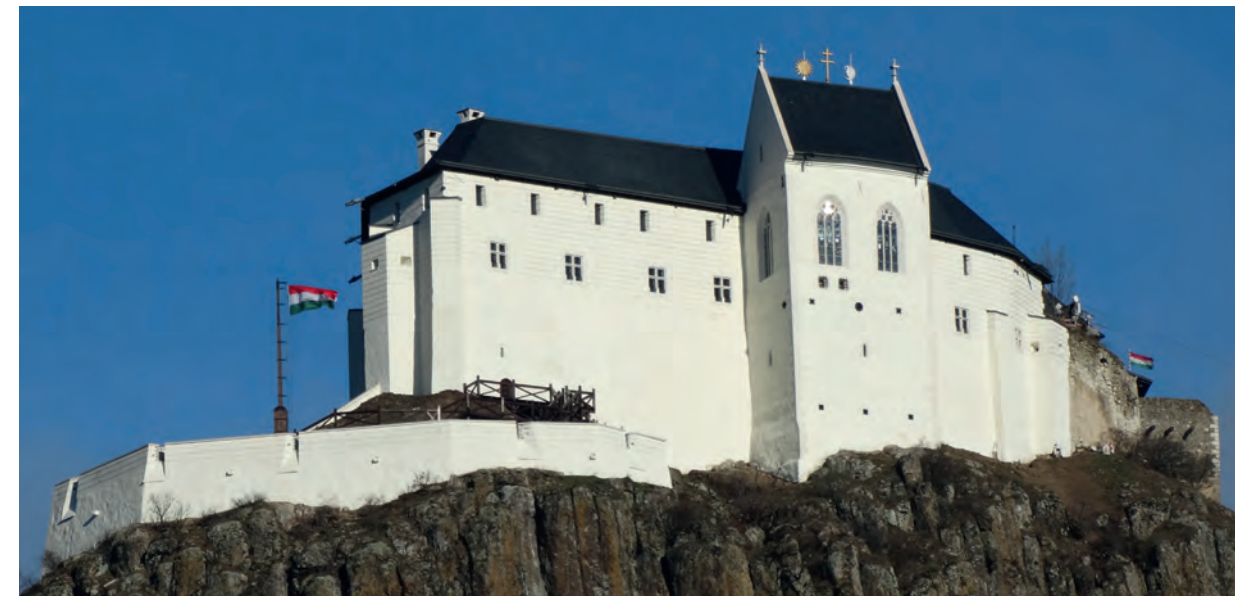
A felső vár 2016-ban