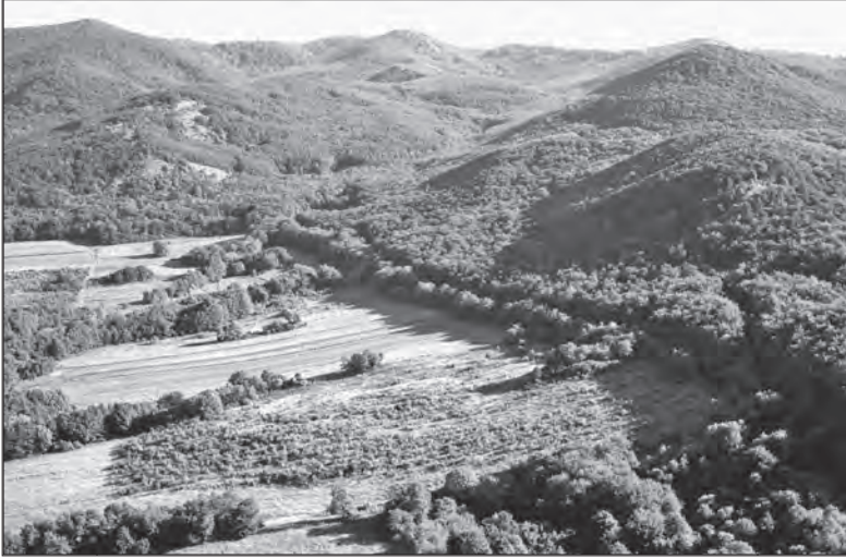
Elcserjésedő és művelt parcellák a füzéri Vár-hegyről az egykori szőlőhegy irányában.

ködés lehetőségeit felhasználva egy olyan gazdasági-társadalmi környezet kialakítása, mely alkalmas a térség vidéki népességének megtartására. A rurális területek fejlesztési stratégiáinak kidolgozása és végrehajtása közben a fenntarthatóság eszmerendszerének érvényesülését alapvető fontosságúnak tartja.