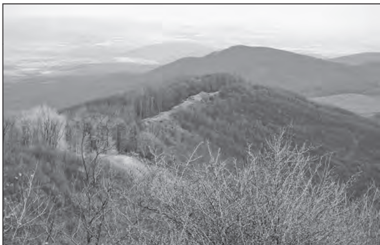
A Tokaj-Zempléni-hegyvidék északi részén, hegygerincen húzódó államhatár Füzér hajdani községhatárában.

Munkánk során a peremhelyzetbe került rurális medencetáj adottságait és lehetőségeit kívánjuk felmérni, felhívni a figyelmet a veszélyeztető folyamatokra. A jövő kihívásainak való megfelelésben e kistérségnek olyan szerepkört érdemes és szabad betöltenie: mely megőrzi arculatát, biztosítja a természeti és kulturális értékvédelmet, és a helybelieknek is megteremtí a megélhetés feltételeit.