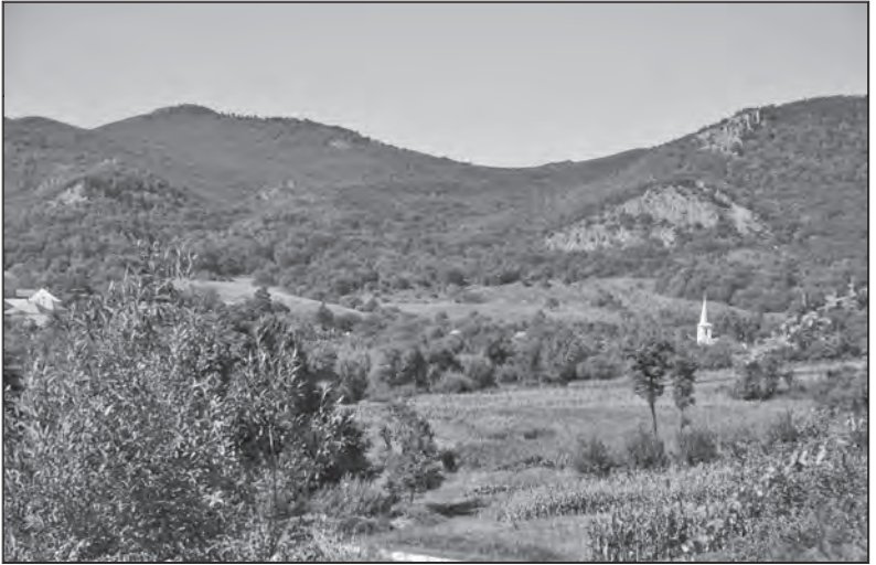
A Tolvaj-hegy Pusztafalu felett.

cselekvési témakörökben jelennek meg. A natúrpark egyrészt lehetőséget nyújt kiegészítő források régióba történő bevonására, alapot teremt ezen eszközök optimális hasznosítására, valamint az innováció, kreativitás és beruházási hajlandóság emberi készségeit fejleszti (Ld. LEADER programok).