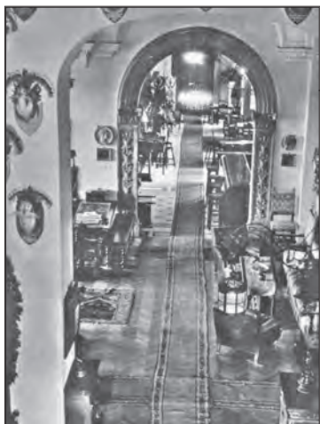
Foyer a Kastélyszállóban