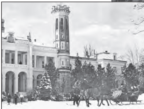
Füzeérradványi Kastélyszálló téli szánkózás idején

Károlyi László fia, István szintén hódolója volt a vadászat szenvedélyének, s barátjával Széchenyi Zsigmonddal együtt kalandos, külföldi vadászatokon vett részt. A rendszeres vadászatok, valamint a Fóton létesített új állatkertje igen költséges szórakozásnak bizonyultak. Ennek ellensúlyozására a jórészt kihasználatlanul álló füzérradványi kastélyt 1936-37-ben luxusszállodává alakították át. Bevezették a villanyt, hideg-meleg vízzel látták el, és jelentősebb belső átalakításokra is sor került. Az épületet és környékét minden lehetséges kényelemmel ellátták. Ekkor építették meg a strandot, tenisz-, golf-, ródli-, sípályákat alakították ki. Lehetőség nyílt horgászásra, csónakázásra és lovaglásra és hintózásra egyaránt. Kastélyszálló 1938. május 8-án nyílt meg, s az 1945 előtti Magyarország népszerű kastélyszállójához a lillafüredi palotaszállóhoz hasonló népszerűsége tett szert 4 .