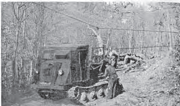
Az átépített KT 12-es kitűnő munkát végez a Sátor-hegységi nehéz terepen

Mindenképpen kitűnő munkát végeztek a sárospatakiak a berendezések elkészítésével és mindhárom gépcsoport komoly szerepre hivatott a sárospataki erdőgazdaság közelítési munkájának elvégzésében.