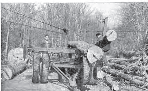
A kötélpályás közelítő berendezés közvetlen gépkocsra tereli a kiértelt faanyagot