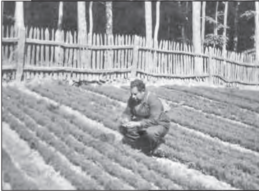
Az Alsó-csemetekert és dolgozói, erdősítk