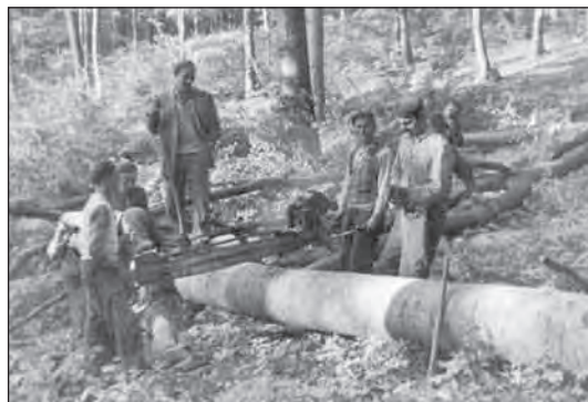
Döntés és darabolás MRP motorfűrészszel