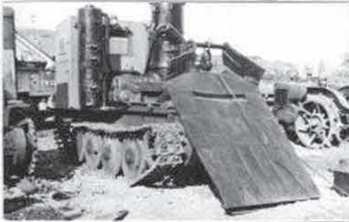
KT-12 lánc talpas traktor