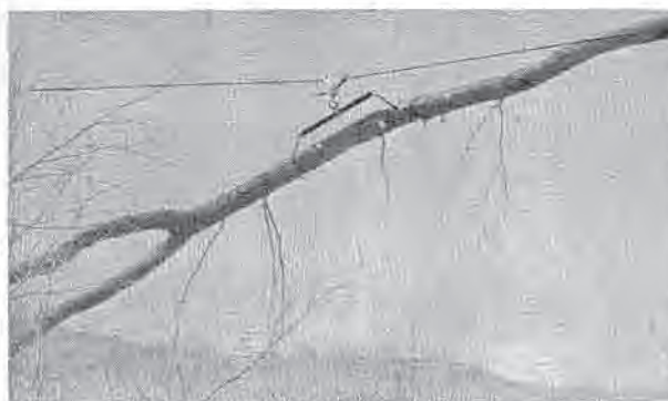
Az automatikusan működő befogó szerkezet munka közben a meredek lejtő felett