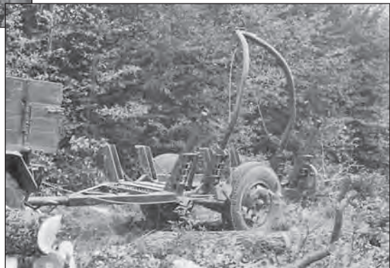
Egy füzéri Unimogos komplex brigád és a ZELOP