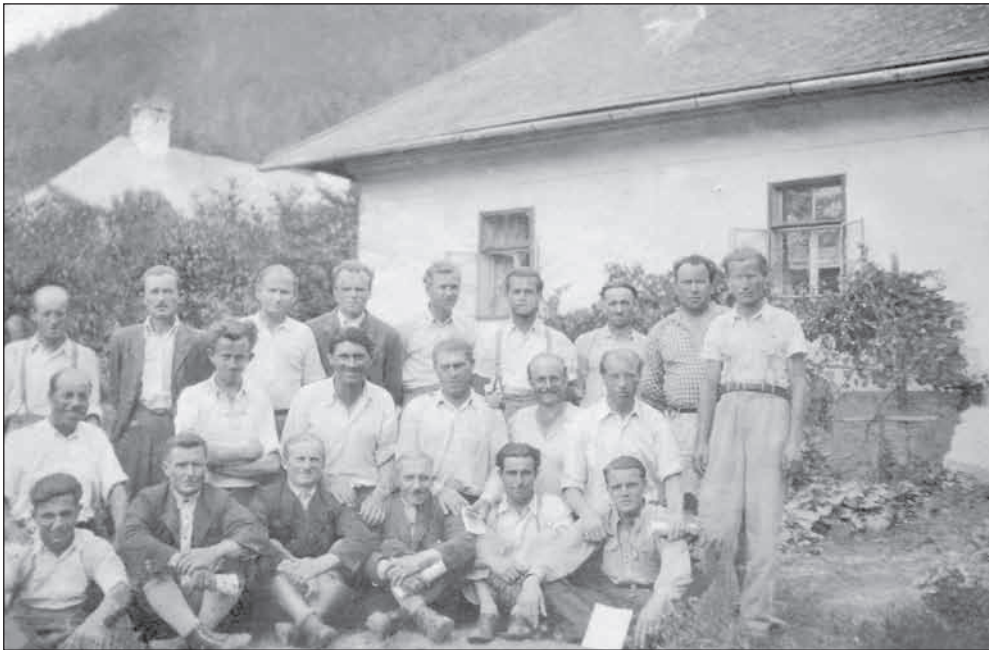
Védkerület vezetők a füzéri tanfolyamon 1950 nyarán

Az 1950. január 1-jén kezdődő első ötéves terv keretszámait jelentősen felemelték, így ismét 15 800 m 3 lett a fakitermelési feladat. A dogmatikus-szektás politika különösen falun éreztette káros hatását, aminek következtében károsan megváltoztak a körülmények.