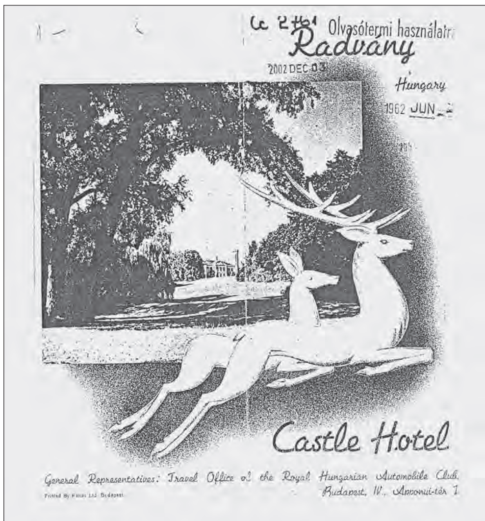
A Kastély Szálló tájékoztatójának címlapja