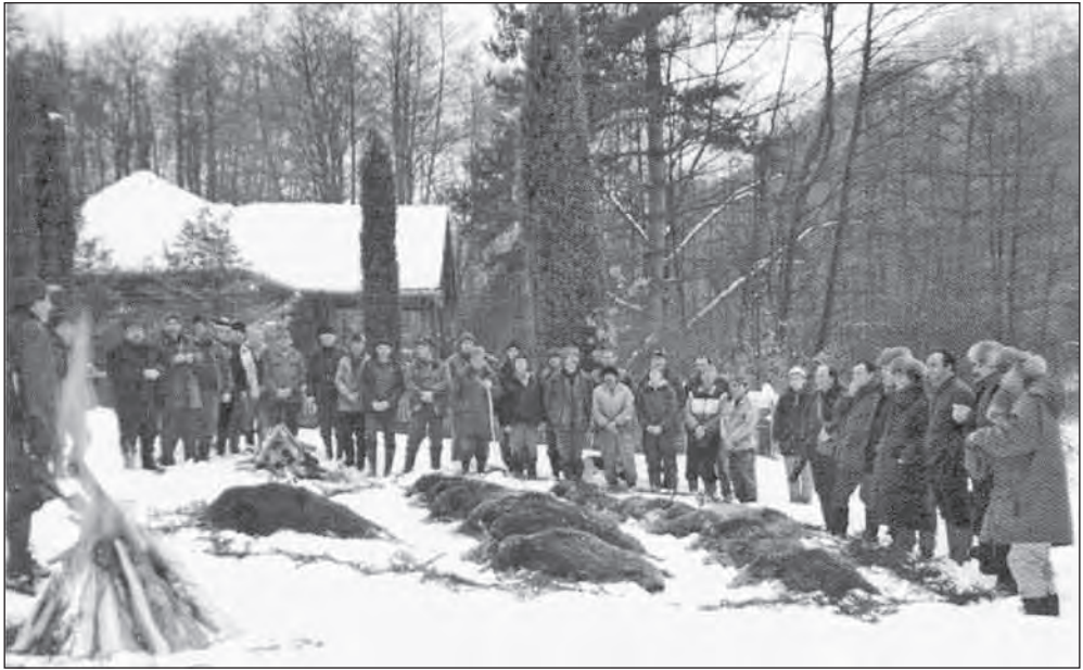
Francia vadászok a Zemplénben (Kökapu, 1993.)