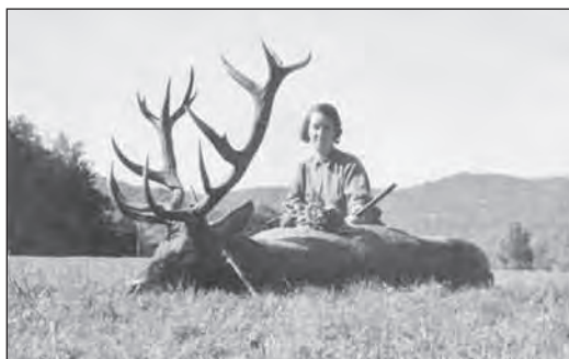
A berlini aranyérmes és elejtője