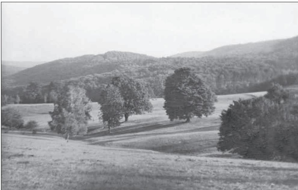
„a gyönyörű Bodó-rét”

„Erdész vagyok...Vadász vagyok...Életem célkitűzése az, hogy az erdészetet és a vadászatot, az erdőt és a vadat értékük megbecsülésében összeegyeztessem... Megállapításaimnál állandóan azt... tartottam szem előtt, hogy a természet egyensúlyának megbontásával tönkremegy az erdő, de ugyanez a sors éri a túlszaporodott szarvasállományt is... erdésznek és vadásznak egyformán szeretni kell a természet nagy templomát és meg kell érteni, hogy ott fának, vadnak és madárnak egyformán joga van élni, de úgy, hogy a már úgylát kibillent egyensúly legalább nagyjából helyreállhasson.”