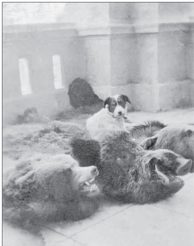
A marócai medvék és a kapitális kan