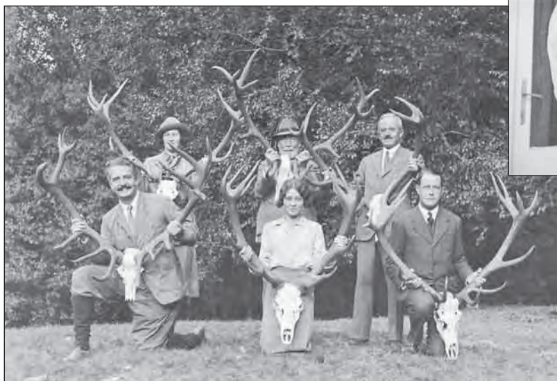
Trófeák és elejtők Lászlótanyán