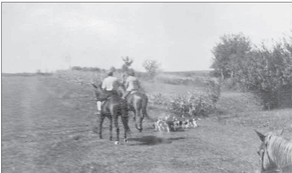
Indul a falka Füzéren

„Vettem 2 kant és 3 szukát... az istálló mögött szép, angol mintájú ólakat csináltattam nekik... Az évek folyamán neveltem ezekből vagy 25-öt... Komlós-Füzér-Pálháza közötti területen vadásztunk 6-7 kopóval... nagy hiba volt őket oda vinni...a terület szűk volt... ha felugrott egy nyúl, rögtön az erdő felé tartott... és főleg a lakosság nem szerette, mert féltek, hogy kárt csinálunk. Pedig már le volt aratva... csak a barázdában lovagoltunk... nem volt nagy élvezet... el is vittem őket Főtra.”