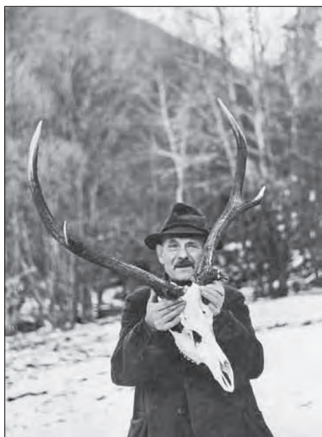
Az öreg Kababik