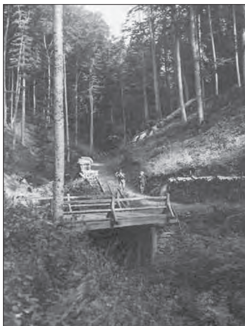
Bükkfáshegyi híd Füzér