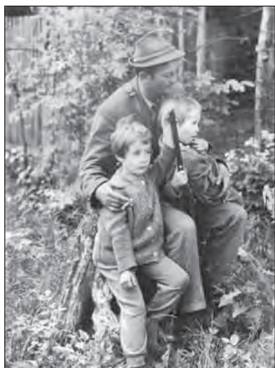
Az erdész és a csemeték