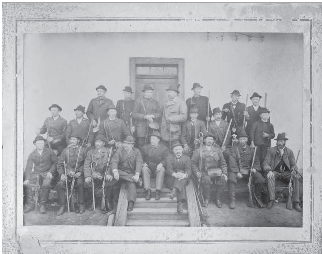
Uradalmi szakember gárda