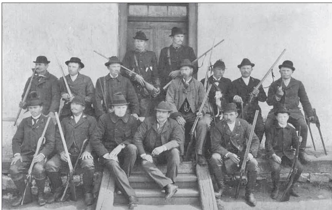
A füzéri erdőgondnokság személyzete, 1906