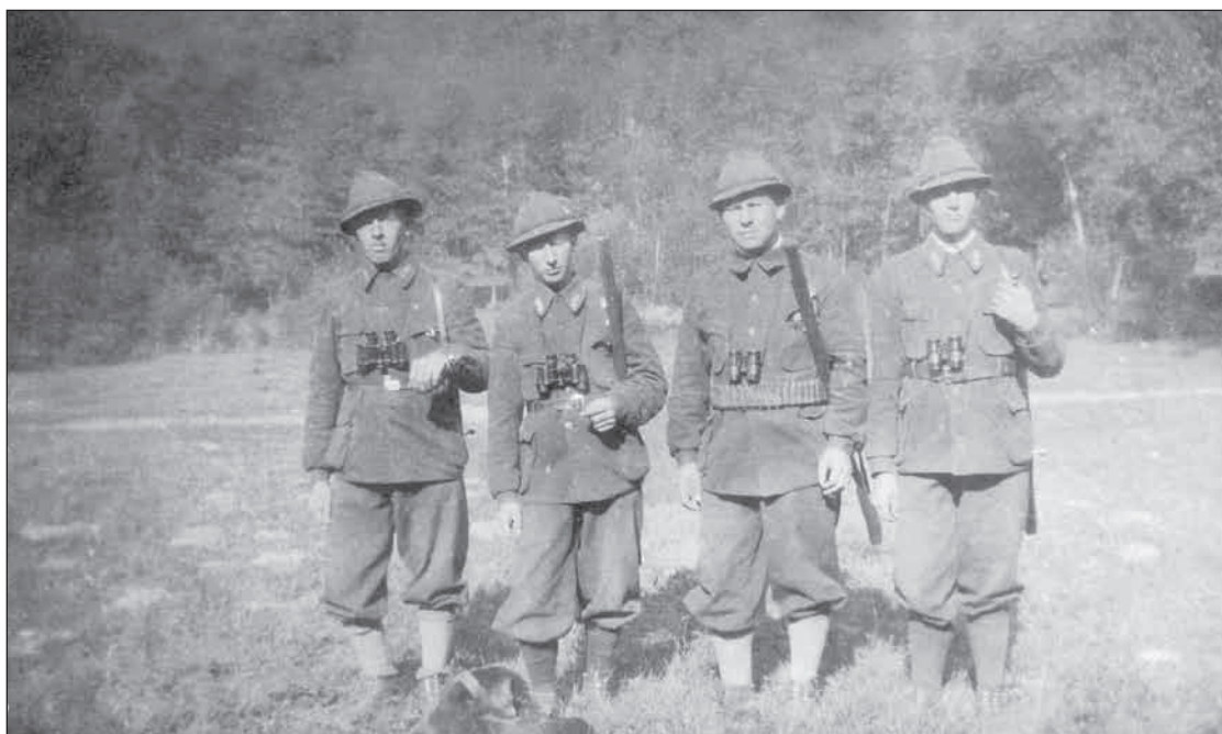
Füzeri erdőőrök, 1940-es évek