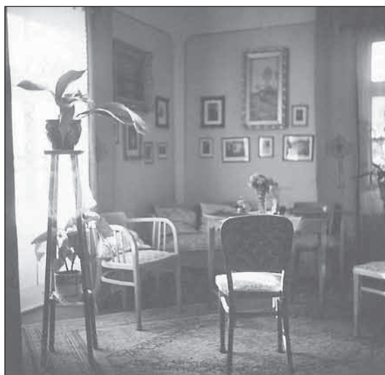
A füzéri erdőmester lakása és irodája