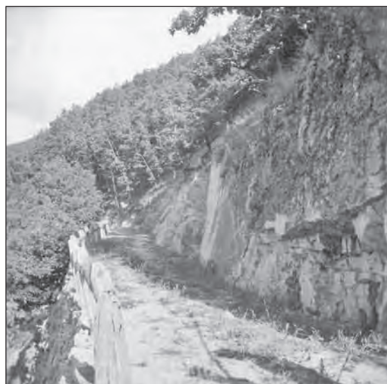
Bükkfáshegyi út, Füzér