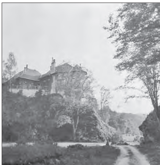
Kőkapu 1940 körül