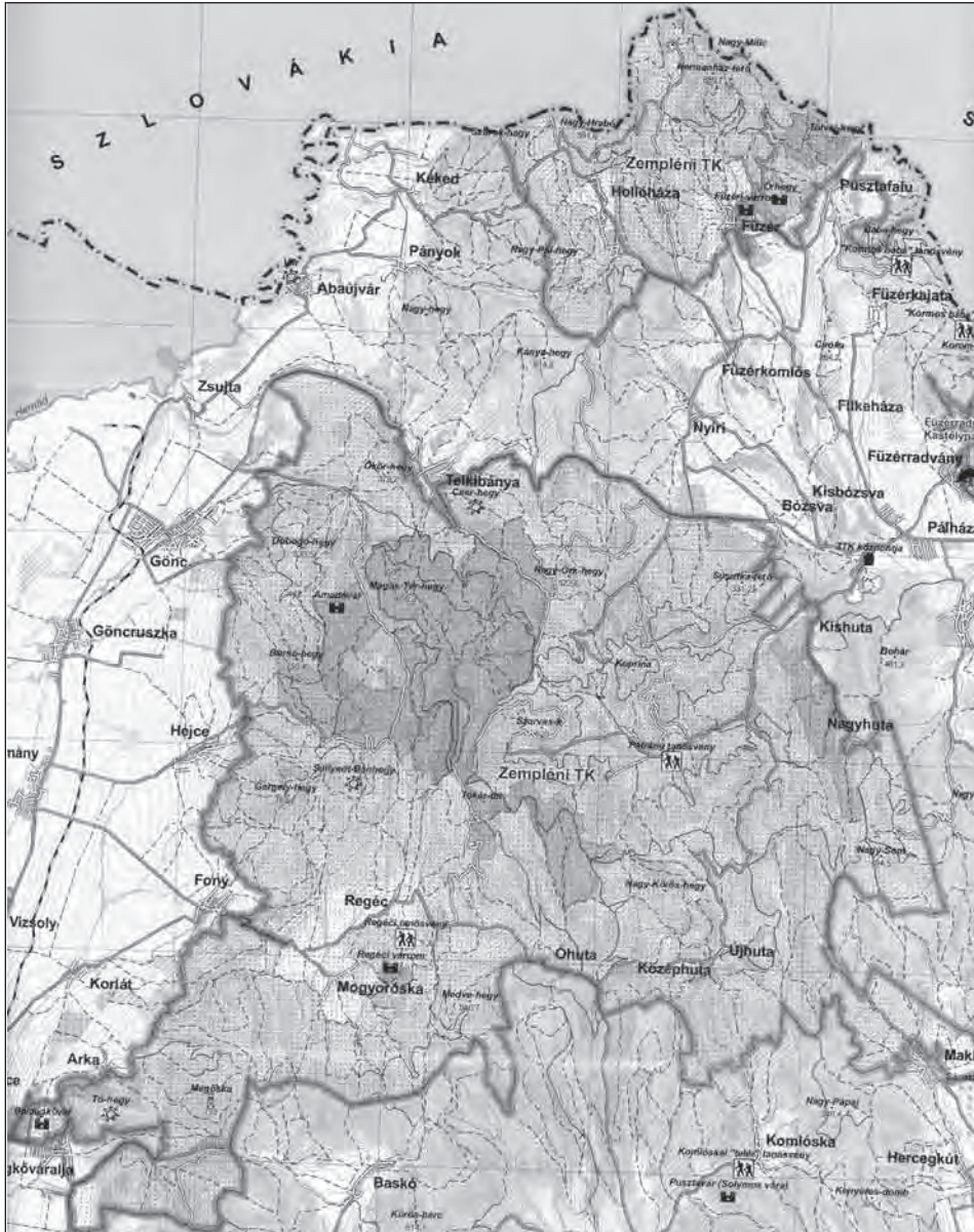
Zempléni Tájvédelmi Körzet – térképrészlet (In: BARÁZ CSABA, KISS GÁBOR (szerk.) (2007): A Zempléni Tájvédelmi Körzet – Abaúj és Zemplén határán – Térképmelléklet)

Az Országos Környezet- és Természetvédelmi Hivatal 1/1984. sz. rendelete 28 341 ha területtel kijelölte és természetvédelmi területté nyilvánította a Zempléni Tájvédelmi Körzetet (ZTK).