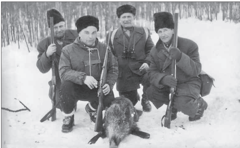
Erdészek – vadászok a 70-es években

A személyzeti kérdéseknél külön is figyelmet érdemel, hogy helyben, esetenként családon belül oldották meg a szakember utánpótlást. 1945-ben a személyzet 77 %-a szakképesítés nélküli erdőkerülő volt, de 1963-ig valamennyien letették a szakvizsgát. A nyugdíjazottakat is helyből pótolták, a rátermett, tanulni vágyó fiatalokból szakmunkás-hosszító-erdész-erdésztechnikus lett. Éveket, évtizedeket töltöttek ugyanabban a kerületben. Ismertek minden fát, cserjét, újulatot, vadat, virágot, sziklát és ez is hozzájárult sikereikhez.