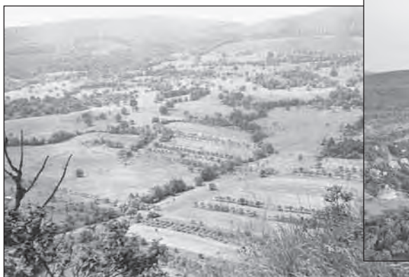
Füzér község feletti gyepterület, 1974.

Füzér község határ a 15/A Hegyköz erdőgazdasági tájrészletbe tartozik. Alapkőzete andezit és riolit, talaja barna erdőtalaj, lejtőhordalék és kavicsos vázталajok. A terület tengerszint feletti magassága 250-890 m, zömét meredek hegyoldalak képezik. Klímája erős hegyvidéki, montán hatásokat mutat, az alacsony évi középhőmérséklet (a Nagy-Milicen 5,6 C°), a kettős csapadék maximum (június és decemberben), a fagyos és havas napok nagy száma (50-80 nap) kedvezőek az erdő fejlődésére és kevésbé felelnek meg más művelési ágaknak.